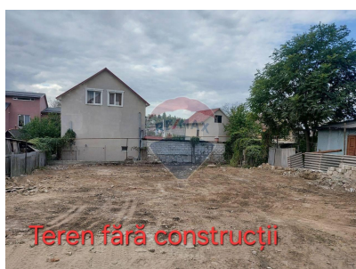
Teren fără construcții