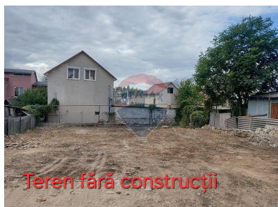
Teren fără construcții